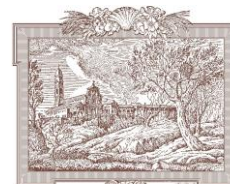
San Michele in Bosco Area Monumentale I.R.C.C.S

Istituto di ricovero e cura a carattere scientifico