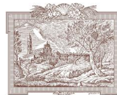
San Michele in Bosco Area Monumentale I.R.C.C.S

Istituto di ricovero e cura a carattere scientifico